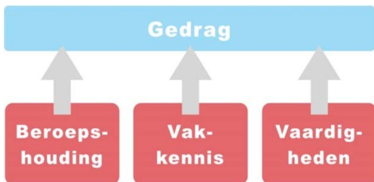
Figuur 2: Beschrijving van de kwalificaties

De kwalificaties worden in het Regioprofiel beschreven in termen van gedrag, kennis, vaardigheden en beroepshouding (zie Fout! Verwijzingsbron niet gevonden. ).