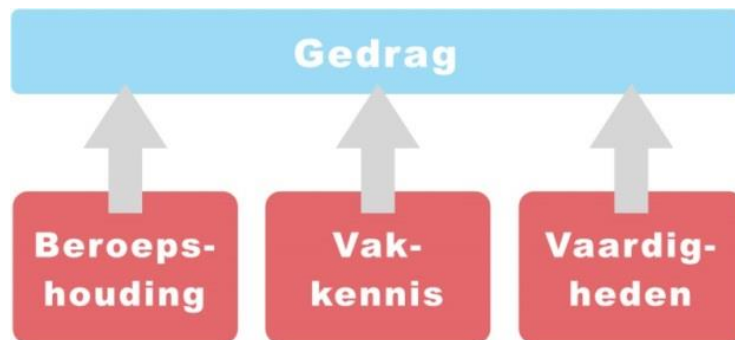
Figuur 2: Beschrijving van de kwalificaties

Bij gedrag gaat het om waarneembare handelingen die nodig zijn voor het goed uitvoeren van een kerntaak. Het gedrag is de resultante van kennis, vaardigheden en de beroepshouding.